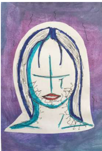
Il.lustració de Dani Dávila. Batx1

Al mon actual, des d'una perspectiva feminista, estem vivint un augment de lluites col·lectives per la igualtat de gènere. La cultura es una peça fonamental en aquesta reivindicació i això la converteix en un acte de resistència que ens alerta i consciència de la falta de representació femenina a diferents àmbits socials.