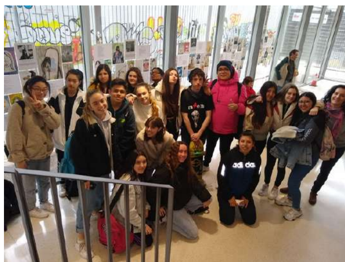
Grup d'artistes de Batxillerat-1 artístic