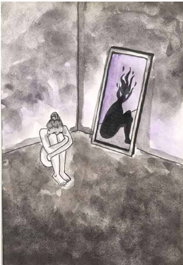
Il·lustració de Elena Retamal. Batx2

Totes les il·lustracions han estat creades per lxs alumnxs del Batxillerat Artístic del Col·legi Jesús Maria de Sant Andreu .