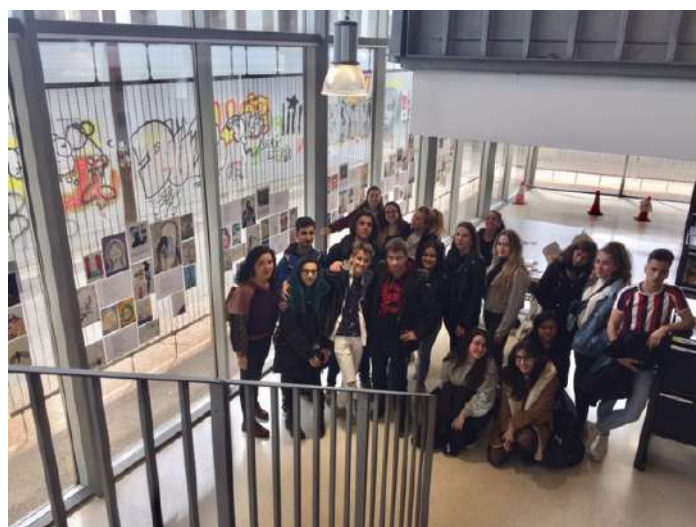
Grup d'artistes de Batxillerat-2 artístic